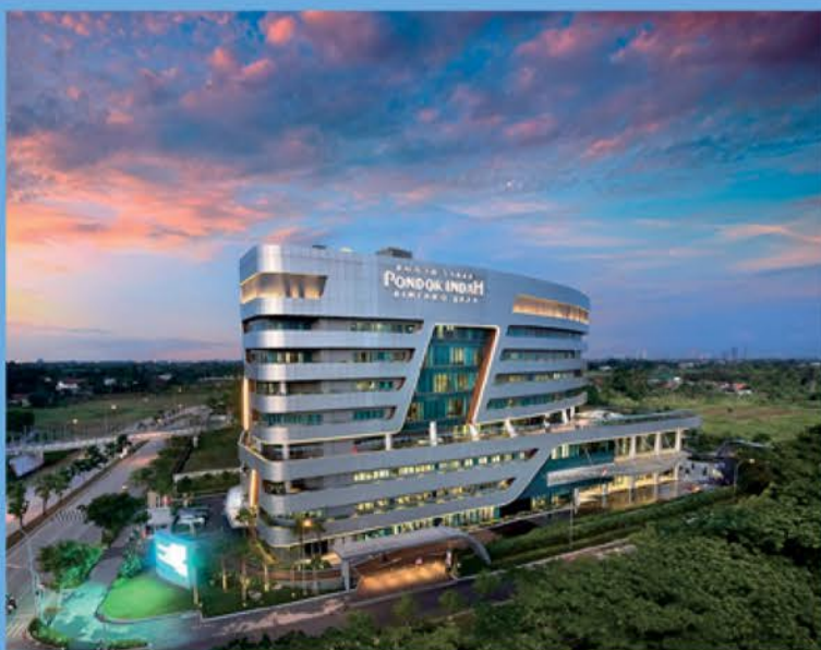
RUMAH SAKIT PONDOK INDAH BINTARO