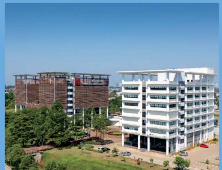
UNIVERSITAS PEMBANGUNAN JAYA

Catatan : Gambar ini merupakan ilustrasi artis. Perubahan dapat terjadi disesuaikan dengan kondisi lapangan. Brosur ini tidak dapat menjadi bagian dari penawaran penjualan/perjanjian tertulis ataupun alat pembuktian hukum lainnya. Untuk pengembangan rancangan, spesifikasi tidak mengikat dan sewaktu-waktu dapat berubah. Fasilitas listrik disesuaikan dengan ketersediaan dan spesifikasi standar PLN.