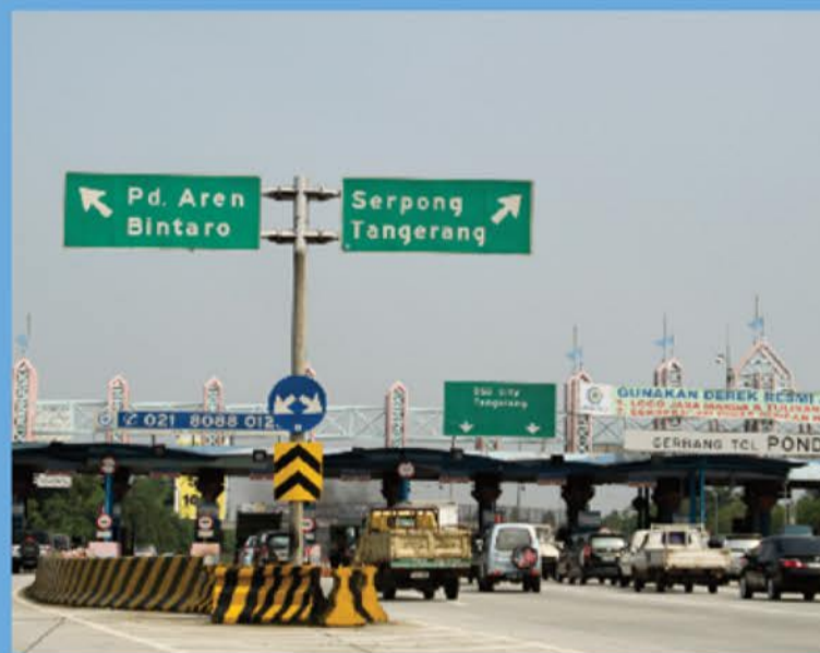
TOL PONDOK AREN