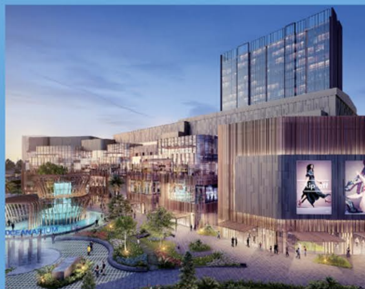
BINTARO XCHANGE MALL