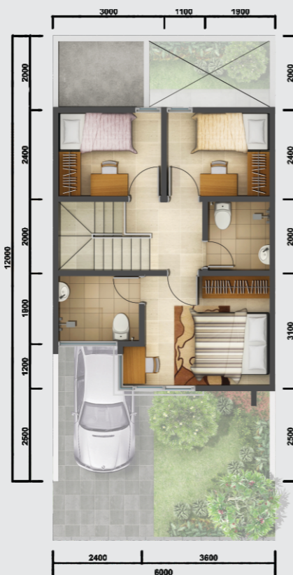
Denah Lantai 2