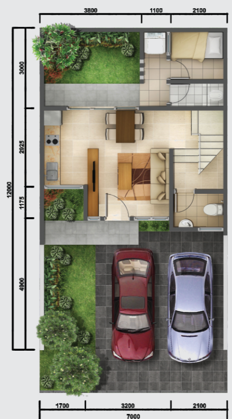
Denah Lantai 1