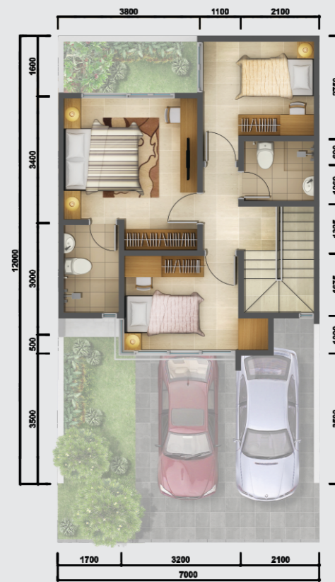
Denah Lantai 2